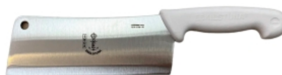
Hachuela filo recto 01PI0120200